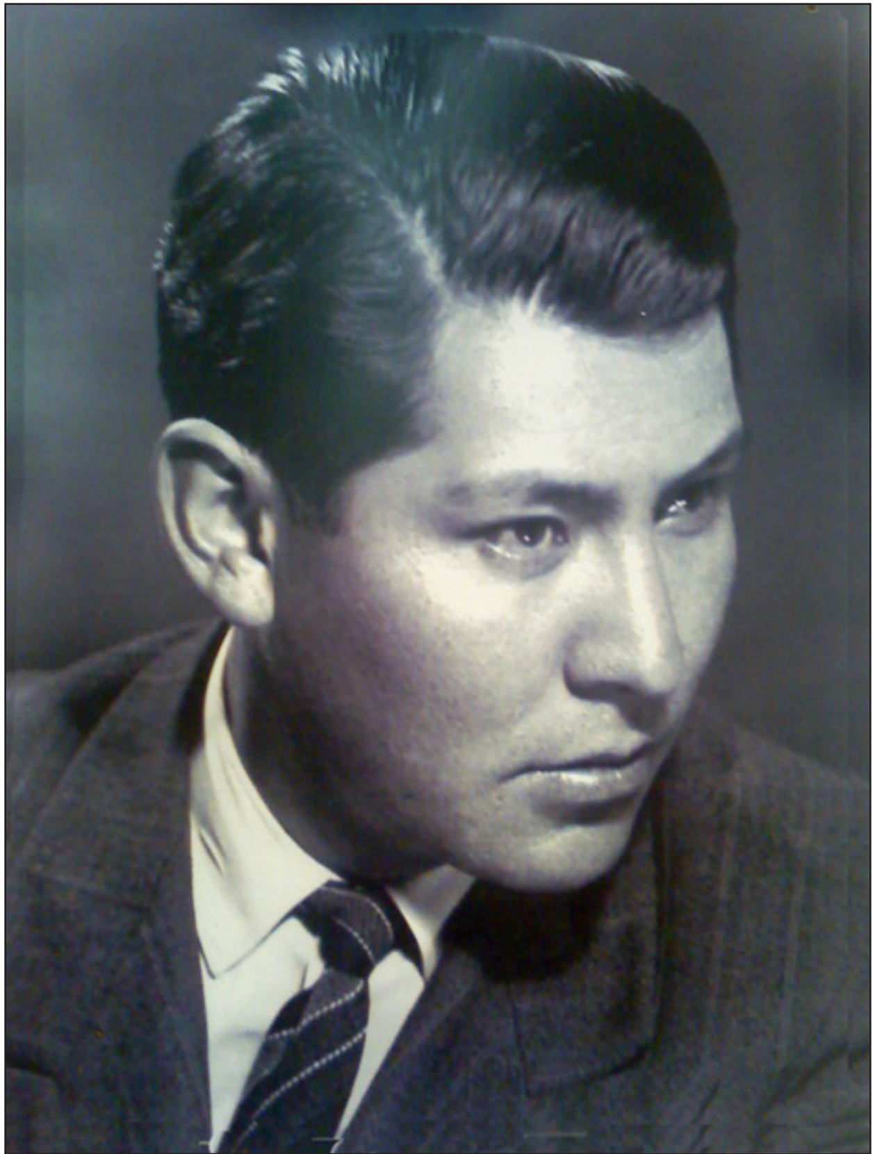
Miguel Alandia Pantoja