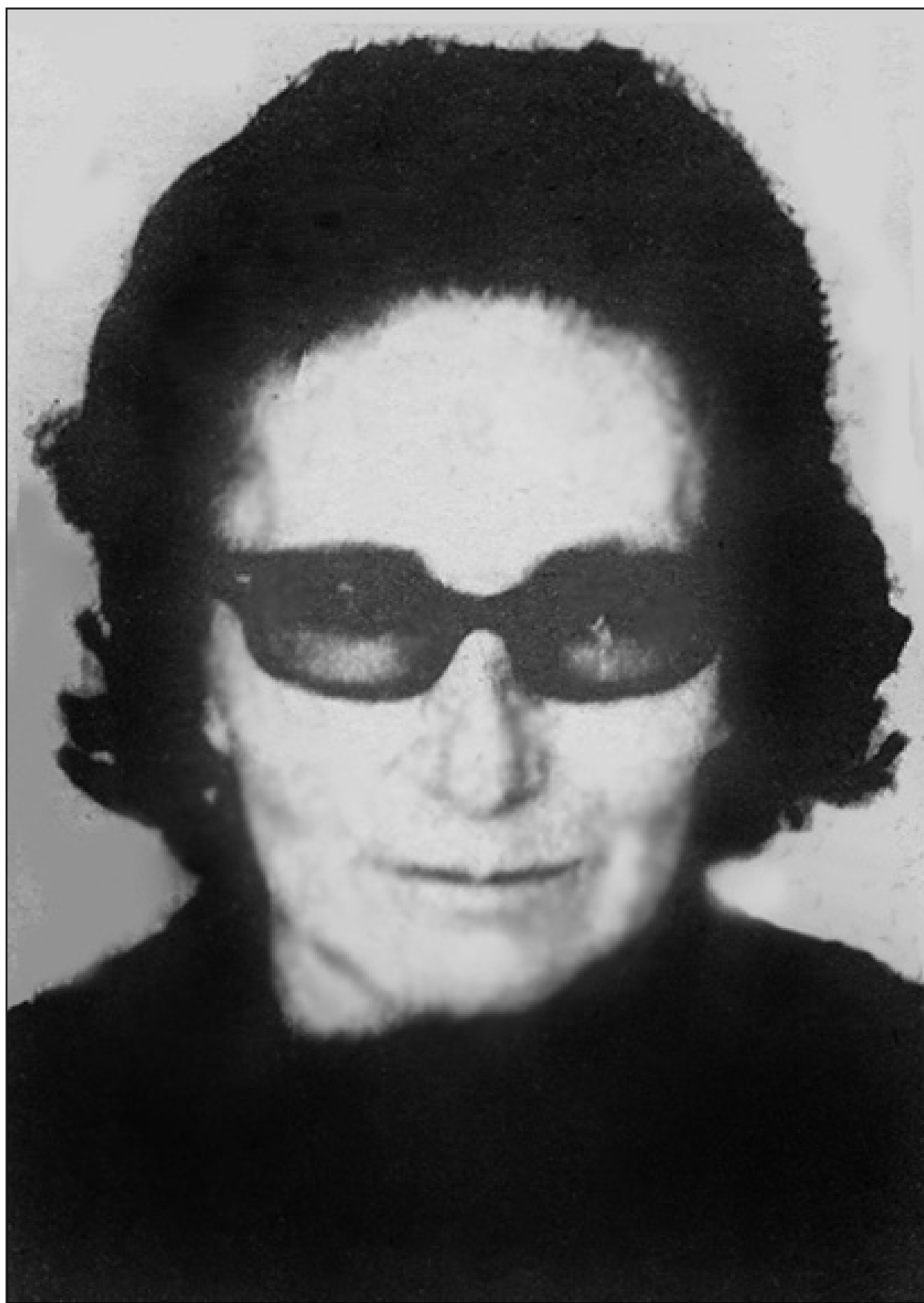
La última fotografía de AGAR PEÑARANDA, revolucionaria ejemplar que entregó su vida a la estructuración del P.O.R.